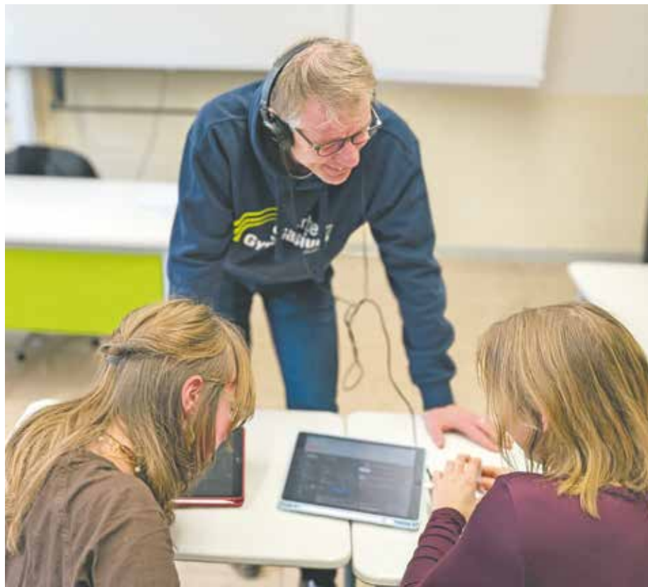
Die Workshops zum Thema „Künstliche Intelligenz“, die im Rahmen der Qualifizierungsoffensive an den Bedburger Schulen durchgeführt werden, sorgen bei Schülern und Lehrern für Begeisterung.

Im September 2024 wurden die Bedburger Schulen erstmals im Rahmen der KI-Qualifizierungsoffensive besucht. Für März sind bereits Fortbildungen für Bedburger Lehrerinnen und Lehrer im Bereich der Künstlichen Intelligenz geplant.