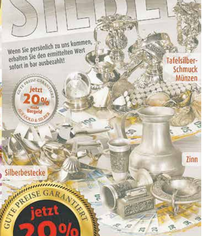
Tafel Silber- Schmuck Münzen