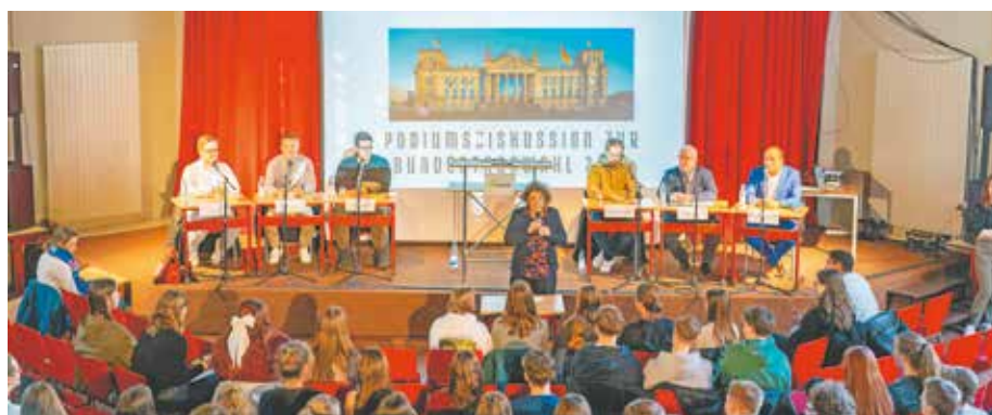
Am Silverberg-Gymnasium fand in Vorbereitung auf die vergangene Bundestagswahl eine Podiumsdiskussion mit den Bundestagskandidaten des Rhein-Erft-Kreises statt.