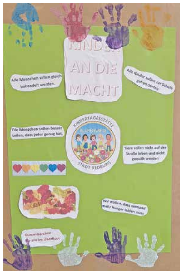
Die Kinder der Kita Blumenwiese haben ihr ganz eigenes Wahlplakat erstellt.

Mit viel Begeisterung präsentierten die Kinder ihr Wahlprogramm und bewiesen damit, dass sie sich bereits in jungen Jahren Gedanken über eine gerechte Welt machen. Ein gelungenes Projekt, das zeigte: Auch die Kleinsten haben große Ideen – und vielleicht wird sich eines Tages eine zukünftige Politikerin oder ein zukünftiger Politiker für genau diese Werte einsetzen.