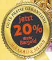
Gold, Münzen Schmuck