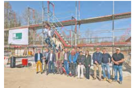
Gemeinsam feierten Vertreterinnen und Vertreter der Stadtverwaltung, der Politik, der Firma ALHO und die Erzieherinnen der neuen Kita Blumenwiese den Spatenstich.

Die hochwertigen und nachhaltigen Raummodule fertigt die Firma ALHO in ihren eigenen Werkshallen an. Dabei handelt es sich um eine serielle, industrielle Bauweise. Die Kita „Blumenwiese“ erhält eine Holzfassade, ein begrüntes Dach und eine eigene Photovoltaik-Anlage. Nach Fertigstellung wurden die insgesamt 28 Module Ende März zur Adolf-Silverberg-Straße nach Bedburg transportiert und werden nun innerhalb weniger Tage montiert. Danach beginnen der Innenausbau sowie die Dach- und Fassadenarbeiten.