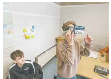
Während der Projektwoche konnten die Schülerinnen und Schüler der Realschule viele neue Technologien ausprobieren.

Dabei reiht sich das Mobile Futurium nahtlos in eine Reihe von zukunftsorientierten Schulprojekten ein. So wurden die Schülerinnen und Schüler der weiterführenden Schulen bereits zwei Mal