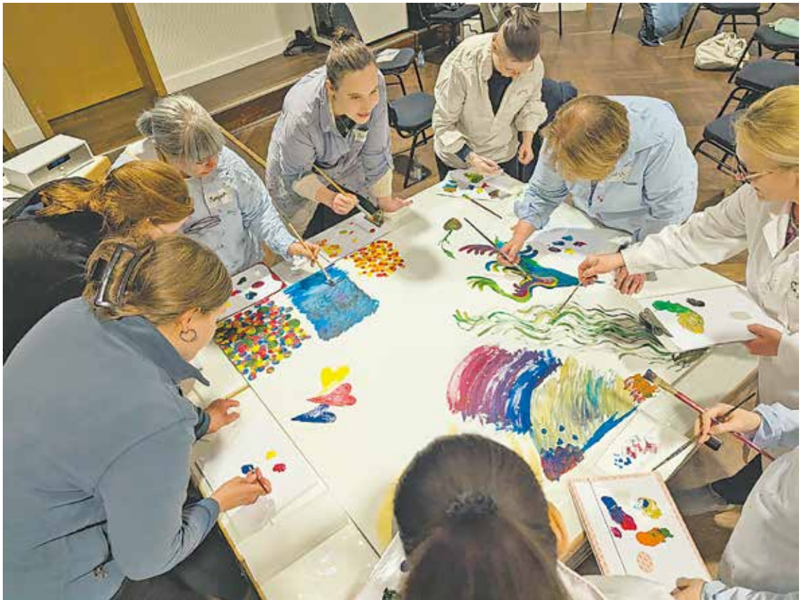
Bei der „Night of Women“ wurde unter anderem gemeinsam gemalt.