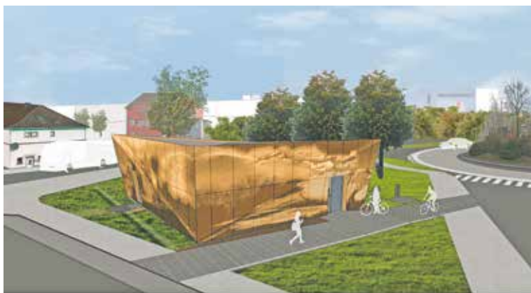
Die Grafik veranschaulicht das künftige Fahrradparkhaus am Bedburger Bahnhof. © Stadt Bedburg, archigraPhus, Diana Ramaekers

Wolken, Strömungen der Erft, des Tagebaus und der Naturlandschaft. Die abstrahierte Bildreihe, die sich rund um das Gebäude zieht, wird in das Lochblech gestanzt. Alle verwendeten Bilder wurden in und rund um Bedburg aufgenommen. Die nächtliche Beleuchtung aus dem Inneren des Gebäudes macht diese Bilder auch in der Nacht sichtbar und trägt gleichzeitig zur Sicherheit des Fahrradparkhauses bei.