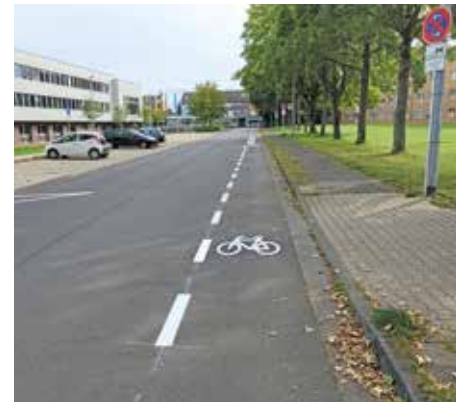
Fahrradschutzstreifen, wie hier an der Gustav-Heinemann-Straße in Kaster, erkennt man an der unterbrochenen Strichlinie.

Tempo-30-Zonen dürfen nur auf Straßen ohne jegliche Leitlinien eingerichtet werden. Im Umkehrschluss bedeutet dies, dass Schutzstreifen ebenso wenig in Tempo-30-Zonen eingerichtet werden dürfen – dies ist laut Straßenverkehrsordnung ausdrücklich verboten. Einen Sonderfall bilden hierbei Einbahnstraßen, in denen die Markierung eines Schutzstreifens unter verschiedenen Voraussetzungen möglich ist.