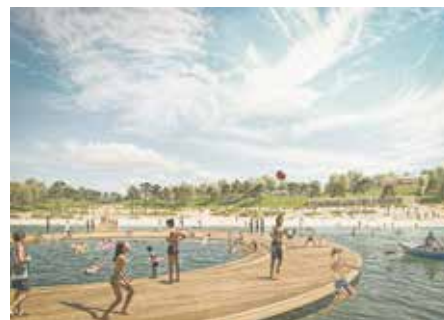
So könnte einmal die Strandlandschaft zwischen Bedburg und Jackerath aussehen.

Der vollständige „Masterplan Seentwicklung Tagebau Garzweiler“ hat 186 Seiten und ist unter www.landfolge.de/seeentwicklung abrufbar.