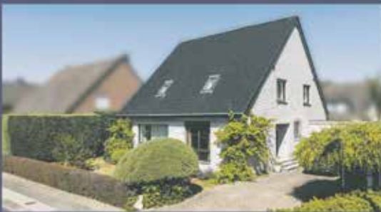
EINFAMILIENHAUS IN BEDBURG GROSSZÜGIG · LICHTDURCHFLUTET · KOMFORTABEL