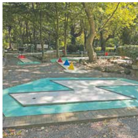
Der Minigolfplatz am Bedburger Freibad hat seit Mitte Juli wieder geöffnet.

Im Rahmen des Investitionspakts zur Förderung von Sportstätten NRW wurden insbesondere die Sanitär-