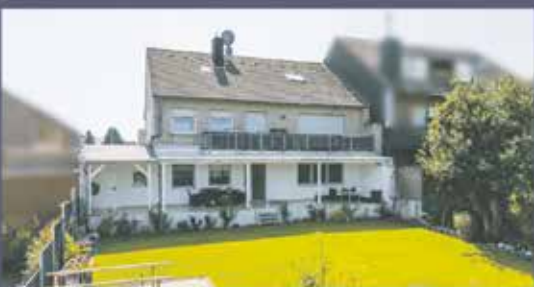
MEHRFAMILIENHAUS IN BEDBURG OFFEN · LICHTDURCHFLUTET · FAMILIENFREUNDLICH

Exklusiv für Leserinnen und Leser der Bedburger Nachrichten Kostenfreie Immobilienbewertung bei Ihnen vor Ort!