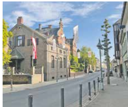
Die Änderungen in der Innenstadt sollen für einheitliche Regeln und mehr Sicherheit sorgen.

Durch die neue Zonierung, die reduzierte Zeichenanzahl und eine moderne, verständliche Beschilderung wird eine rechtskonforme, nachvollziehbare und kontrollierbare Verkehrsordnung hergestellt. Die Stadtverwaltung bittet alle Verkehrsteilnehmenden um Beachtung der neuen Regelungen und bedankt sich für das Verständnis während der Umsetzungsphase.