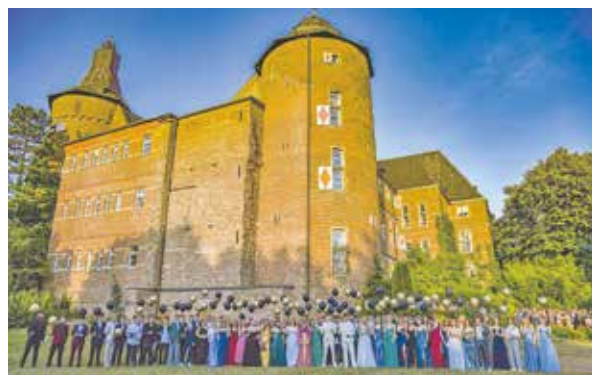
Der Abiturjahrgang des Silverberg-Gymnasiums feierte im Bedburger Schloss.

den Händen und seid bereit für neue Wege – ob in der Arbeitswelt, im Studium oder zu einem anderen spannenden Schritt in eure Zukunft. In diesem Sinne wünschen wir allen Absolventinnen und Absolventen der Abschlussjahrgänge 2025 für den weiteren Lebensweg viel Erfolg, Glück, Gesundheit und vor allem Freude bei allem, was vor euch liegt.