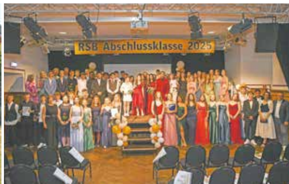
Zahlreiche Schülerinnen und Schüler der Realschule feierten Anfang Juli gemeinsam ihren Abschluss.