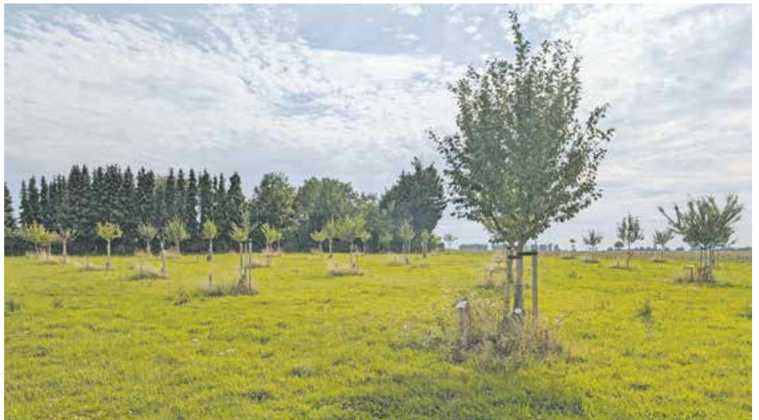
Die Storchewiese in Grottenherten ist voller Erinnerungen. Das erfolgreiche Konzept wird jetzt in Bedburg-Rath fortgeführt.

Interessierte können sich bis zum 15. September 2025 bei der Stadtverwaltung Bedburg verbindlich anmelden. Für Fragen und Anmeldungen steht die Stadtverwaltung unter der Telefonnummer 02272 / 402 605 oder per E-Mail an m.teich@bedburg.de zur Verfügung.