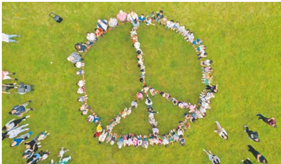
Seit 2022 feiern die jüngsten Bedburgerinnen und Bedburger gemeinsam den Weltfriedenstag für Kinder.

Alle Familien sind herzlich eingeladen und können sich auf Vorführungen, Freundschaftsbänder, Glücksbringer aus aller Welt und natürlich auf das gemeinsame Spielen auf dem Spielplatz freuen. Für Snacks und Getränke wird wieder gesorgt sein. Kommen Sie also vorbei und feiern Sie gemeinsam den Einsatz für Kinderrechte und Frieden weltweit.