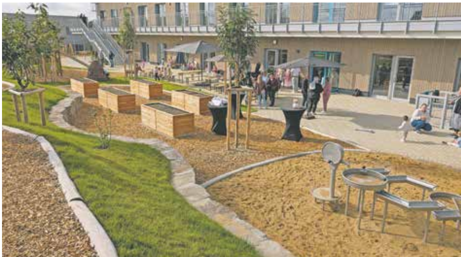
Fünf Monate vom Spatenstich bis zur Eröffnung: Die neue Kita Blumenwiese bietet ab sofort Platz für bis zu 120 Kinder und verfügt über einen großzügigen Außenbereich.

Für die gesunde Ernährung der Kinder gibt es eine großzügige Frischküche und ein Kinderrestaurant