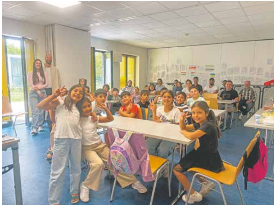
Mit großer Motivation und viel Freude trainierten die Kinder und Jugendlichen in den Ferien, um spielerisch Sprachbarrieren abzubauen.