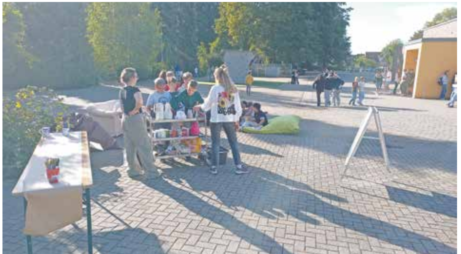
Zur Premiere des neuen Pop-up Cafés am Schulzentrum kamen rund 200 Schülerinnen und Schüler und sorgten so für einen tollen Start des Projekts.