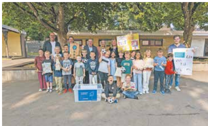
Bälle, Springseile, Wurfspiele: Die Kinder der Anton-Heinen-Schule freuen sich über die neuen Spielmöglichkeiten an ihrer Grundschule.