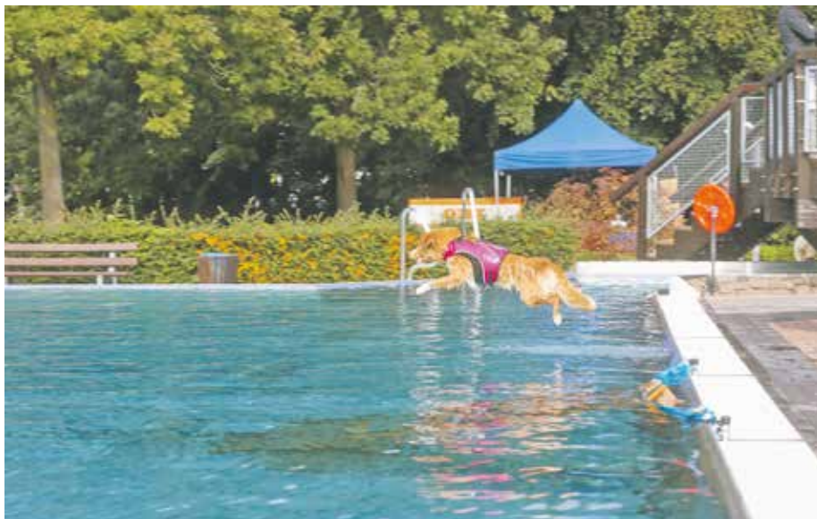
Bereits zum dritten Mal in Folge findet zum Ende der Freibadsaison das Hundeschwimmen in Bedburg statt.

Die Jugendfeuerwehr der Stadt Bedburg hingegen sorgt für ein breites kulinarisches Angebot für die Hundebesitzer. Ebenso ist eine Fotografin vor Ort, um das besondere Vergnügen der Fellnasen direkt bildlich festzuhalten. Der Eintritt beträgt 1 Euro pro Fuß und Pfote, Kinder bis zwölf Jahren haben freien Eintritt.