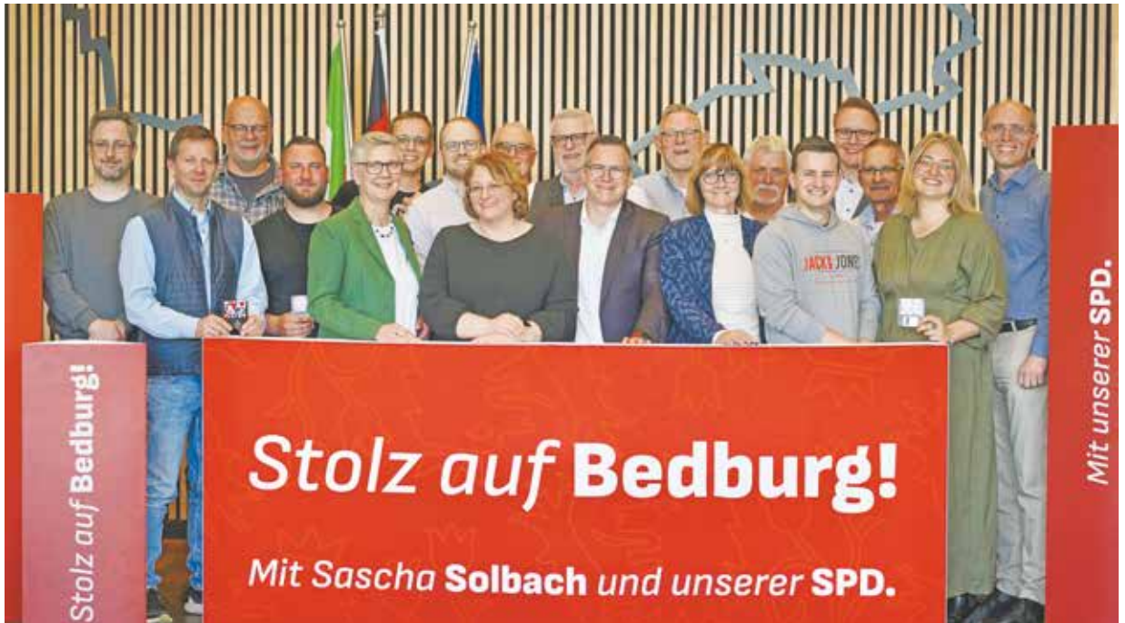
Die Kandidatinnen und Kandidaten der SPD zur Kommunalwahl am 14.09. sind stolz auf Bedburg.