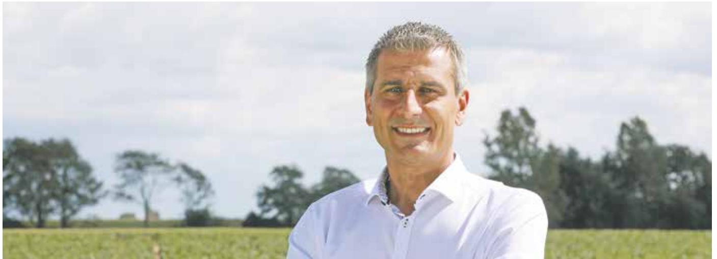
„Die Menschen wollen wieder ‚Mehr Bedburg!‘“

Am frühen Abend kommen wir dann mit dem gesamten CDU-Team, den Familien und Freunden zusammen und lassen den Wahlkampf zusammen ausklingen. Egal, wie es ausgeht. Danach atmen wir alle einmal tief durch und ich werde mich ein paar Tage intensiver meiner Familie widmen – das ist in den letzten Monaten zwischen Vollzeitjob bei der Polizei, dem politischen Alltag der Fraktion und meiner Kandidatur deutlich zu kurz gekommen.