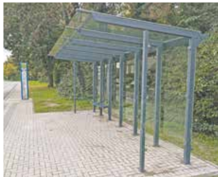
Pünktlich zur kalten Jahreszeit erhalten die barrierefreien Bushaltestellen – wie hier an der Haltestelle „Friedrich-Ebert-Straße“ in Kaster – eine Wartehalle als Schutz vor Wind und Regen.

„Wir freuen uns, mit dem Ausbau ein Stück mehr Teilhabe für alle Bürgerinnen und Bürger in Bedburg zu schaffen und den ÖPNV noch attraktiver und komfortabler zu gestalten. Die Wartehallen richten wir – wo immer möglich – als Schutz vor Wind und Wetter ein. Daher bin ich sehr froh, dass nun auch weitere Haltestellen mit dem