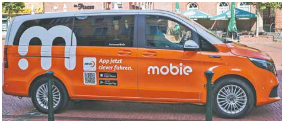
Mit Hilfe der Kleinbusse wird der öffentliche Nahverkehr in Bedburg ab dem Jahr 2027 bestellbar und flexibel.

entwicklungsausschusses der Stadt Bedburg beschlossen. Das Konzept sieht den Einsatz des Shuttle-Service voraussichtlich in der Zeit von Montag bis Freitag zwischen 20:00 Uhr und 2:00 Uhr sowie Samstag und Sonntag von 8:00 Uhr bis 2:00 Uhr, vor. Im nächsten Schritt werden nun Fördermittel beantragt, damit das Projekt ab dem Jahr 2027 starten kann.