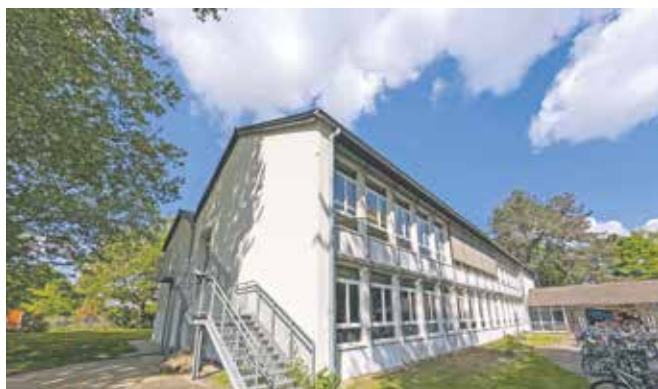
Am Gebäude für die Oberstufe des Silverberg-Gymnasiums entsteht ein Anbau, der unter anderem Platz für neun Klassenräume bietet.

Insgesamt wurden so neun neue Räume für den Unterricht und die Übermittagsbetreuung geschaffen. Die temporären Erweiterungen durch die modernen Containermodule sichern den Platzbedarf bis zur Fertigstellung der umfassenden Erweiterungsbauten.