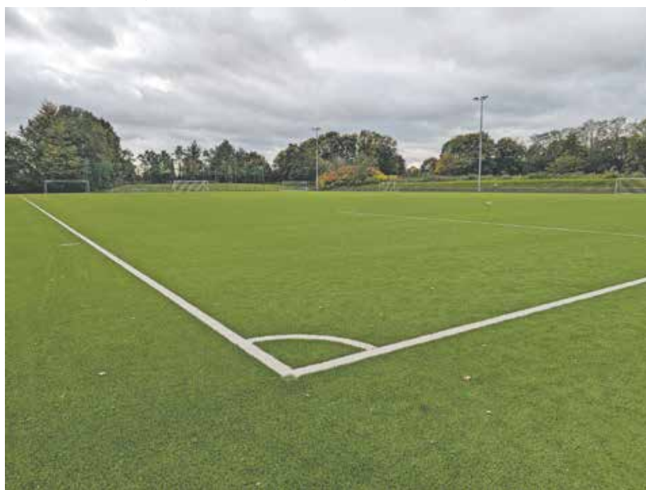
Auch der Kunstrasenbelag auf dem Großspielfeld in der Josef-Balduin-Arena wurde ausgetauscht.

den Fußballerinnen und Fußballern des Bedburger Ballspielvereins von 1912 e. V. wieder genutzt werden.