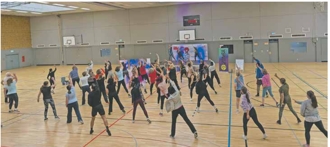
Rund 400 Teilnehmende kamen zu den kostenfreien Sportkursen von „Sport im Park goes Indoor“ in die Bedburger Dreifachhalle.