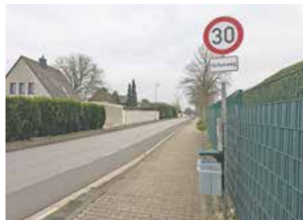
Um die Verkehrssicherheit für Schülerinnen und Schüler zu erhöhen, gilt auf dem St.-Ursula-Weg nun Tempo 30.

die unebene Fahrbahn aufmerksam. Mit diesen beiden Maßnahmen soll die Sicherheit auf den Schulwegen erhöht und gleichzeitig der Verkehrsfluss verbessert werden.