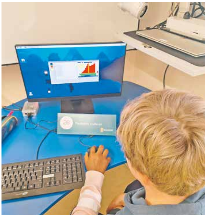
Die Kinder der Anton-Heinen-Schule lernten unter anderem, wie man Pixelbilder codiert.

Im Vorfeld wurden die Lehrkräfte in einer praxisnahen Fortbildung vorbereitet und mit den didaktisch aufbereiteten Materialien vertraut gemacht. Die Schulung befähigt sie, die Inhalte sicher und motivierend mit ihren Klassen umzusetzen - ohne Vorkenntnisse im Fach Informatik.