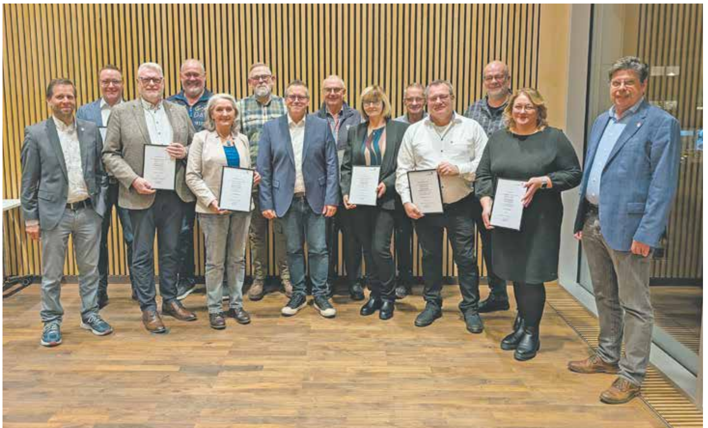
Mit einer Feierstunde wurden die Ortsbürgermeisterinnen und Ortsbürgermeister der neuen Wahlperiode in ihr Amt eingeführt.