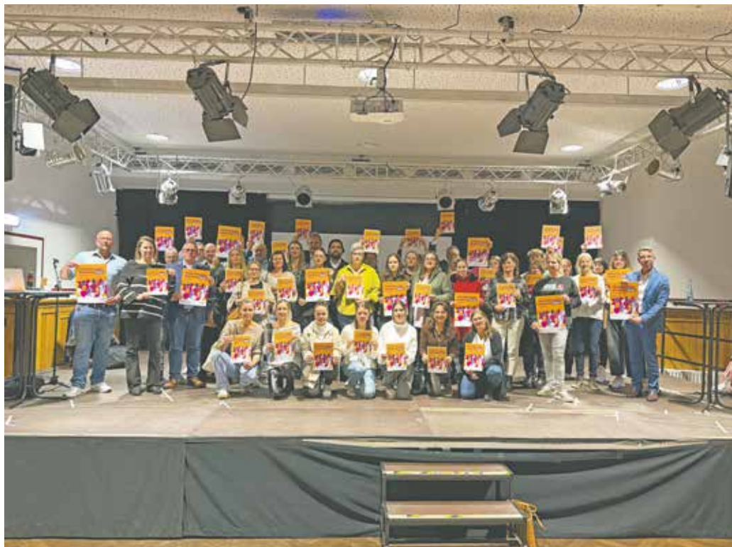
Die Stadt Bedburg beteiligt sich am Aktionstag gegen Gewalt an Frauen.

Mit der Teilnahme am Aktionstag, der jährlich am 25. November stattfindet, unterstreicht die Stadt Bedburg ihre klare Haltung: Gewalt gegen Frauen geht uns alle an. Wir möchten sensibilisieren, informieren und solidarisch an der Seite der Betroffenen stehen.