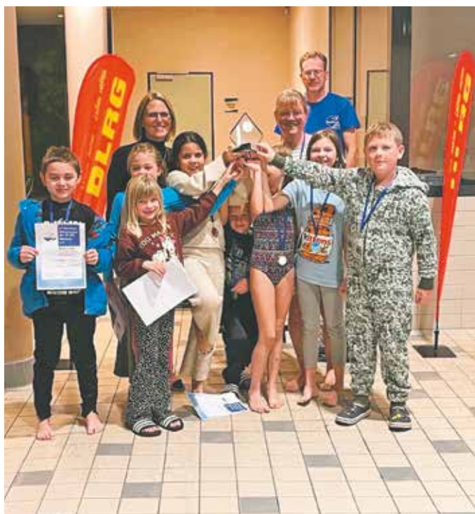
Die Geschwister-Stern-Schule sicherte sich bereits zum elften Mal den Titel als beste Grundschule beim 24-Stunden-Schwimmen.

Insgesamt 44 Schülerinnen und Schüler der Schule gingen an den Start und legten gemeinsam eine Strecke von 121 Kilometern zurück. Einige Kinder übertrafen sich dabei selbst und schafften eine Distanz von bis zu 8.400 Metern – ein Beweis für die enorme Motivation und den unermüdlischen Einsatz der jungen Sportlerinnen und Sportler, den Pokal wieder zurückzuholen.