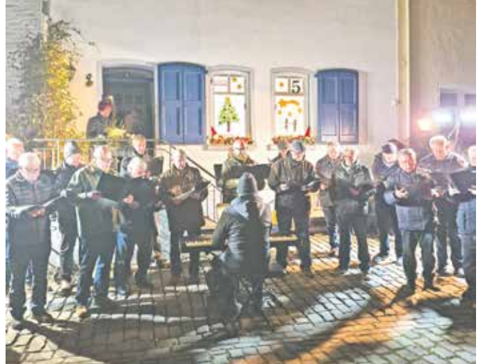
Mit musikalischer Begleitung des Männergesangsvereins eröffneten Eltern, Kinder sowie die Anwohnerinnen und Anwohner das Adventsfenster.

Gemeinsam mit Anwohnerinnen und Anwohnern sowie weiteren Gästen öffneten die Kinder das Adventsfenster Nummer fünf. Unterstützt wurde die Veranstaltung musikalisch vom Männergesangsverein Königshoven, der klassische Weihnachtslieder sang. Im Mittelpunkt des Abends jedoch standen die Kinder und die Bedeutung, Wertschätzung sowie Bereicherung, die sie in unsere Welt bringen.