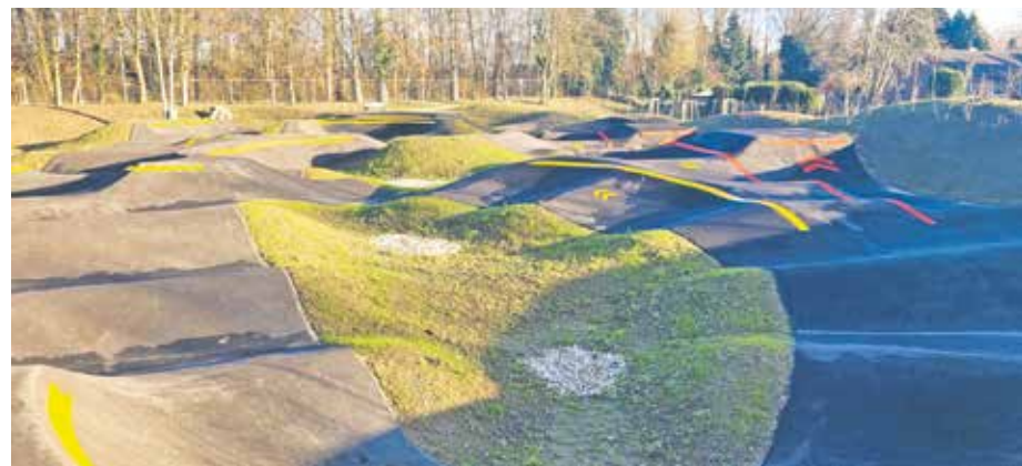
Der nachhaltige Pumptrack ist das Highlight des neuen Mehrgenerationenplatzes in Lipp.

Für die Umsetzung des Projekts erhielt die Stadt Bedburg knapp 590.000 Euro aus dem KoMoNa-Förderprogramm Kommunale Modellvorhaben zur Umsetzung der ökologischen Nachhaltigkeitsziele in Strukturwandelregionen vom Bundesministerium für Umwelt, Klimaschutz, Naturschutz und nukleare Sicherheit (BMUKN) . Das entspricht einer Förderquote von rund 90 Prozent. Ein offizielles Eröffnungsfest wird im kommenden Frühjahr stattfinden.