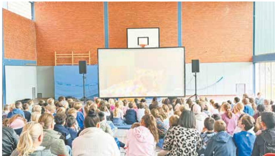
Mit einem weihnachtlichen Film stimmten sich die Kinder der Wilhelm-Busch-Grundschule auf die Adventszeit ein.

lament bei der Auswahl des Filmes mitentscheiden. Gefördert wird das Projekt „Kino am Kiosk“ (kurz KiaKi) über das Bundesprogramm „Demokratie leben!“.